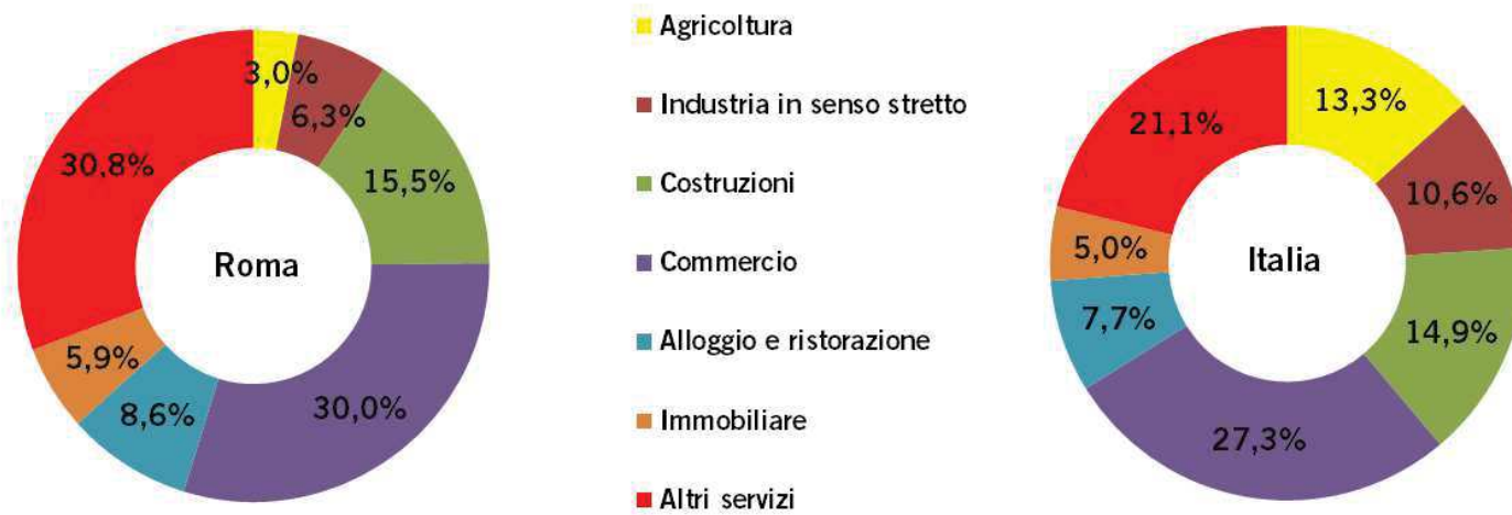
Graf. 3 – Incidenza percentuale delle imprese registrate per attività economica (ATECO2007 al netto delle imprese Non Classificate) al 30 novembre 2016