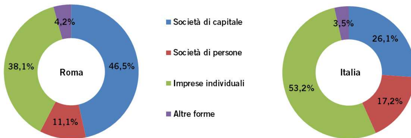
Graf. 2 – Incidenza percentuale delle imprese registrate per forma giuridica al 30 novembre 2016